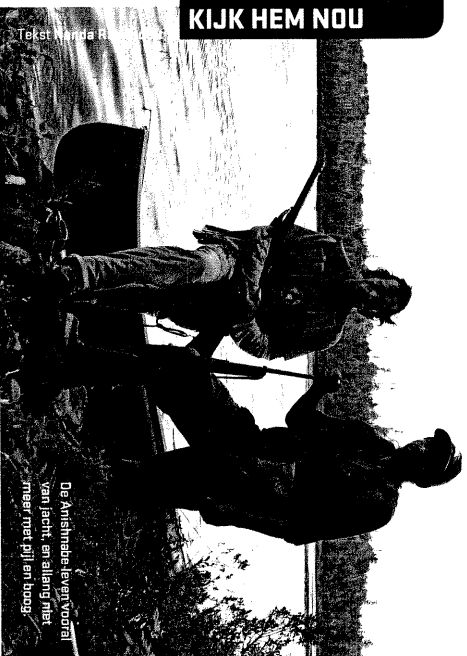
De Anishnabe-leven vooraf van jacht en eilang niet meer met pijn en boeg.

De agressieve houtkap, de overbewissing door toeristen, allerlei dam- en waterprojecten maken het leven er voor de Anishnabe niet makkelijk(er) op. Sommige naties verliezen de hoop en raken de weg kwijt, maar hun veerkracht is over het algemeen enorm. Steeds meer van hen zetten zich in voor heropleving van de traditionele waarden en vaardigheden. Ze maken fantastische kano's uit boom-schors, bij feesten dragen ze prachtige kleding, handgemaakt van dierenhuiden en als een van de laatste weten zij hoe je de tikogam maakt, gevochten rugzakjes waarin ze hun baby's dragen.'