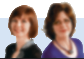
SAMENSTELLING KATY BOELS & INGRID DE VOS

Beste lezers, deze rubriek is de uwe, om te reageren op alle actualiteit en artikels uit de krant. U begrijpt dat we soms een tekstje moeten inkorten of wat herschrijven. Vergoet uw naam, adres en telefoonnummer niet in e-mails of brieven. Beëindig een sms'je met uw naam en postnummer.