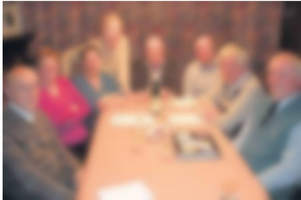
Het volledige bestuur van het Mehringcomité tijdens de jongste bestuursvergadering. Moezelwijn hoort er uiteraard bij.

Het Mehringcomité van Linter bestaat twintig jaar. In die twee decennia wist het comité de zeer ruime regio Linter de weg te tonen naar de prachtige en boeiende wijngemeente aan de Moezel. PAUL PANS