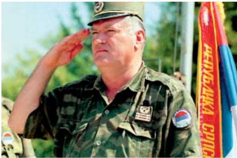
Ratko Mladic, ancien général serbe, est accusé d'être responsable de graves crimes pendant la guerre en ex-Yougoslavie. Sera-t-il jugé?

• Un tribunal spécial a été créé pour juger les crimes de guerre commis pendant les guerres de Yougoslavie. C'est le TPI (tribunal pénal international) et il se trouve à La Haye (Pays-Bas). L'ancien président you-