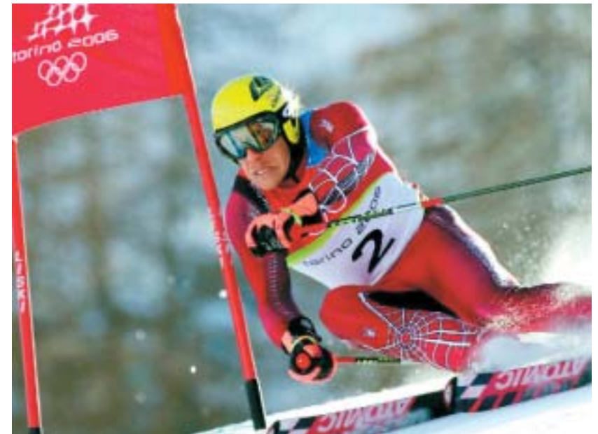
L'Autrichien Hermann Maier a terminé 2 e du Super-G, une descente à skis. Pendant sa carrière, il a récolté 53 médailles en Coupe du Monde.

Dimanche, les flocons tomberont pour la dernière fois sur le site olympique de Turin. Les champions se retrouveront en 2010, au Canada.